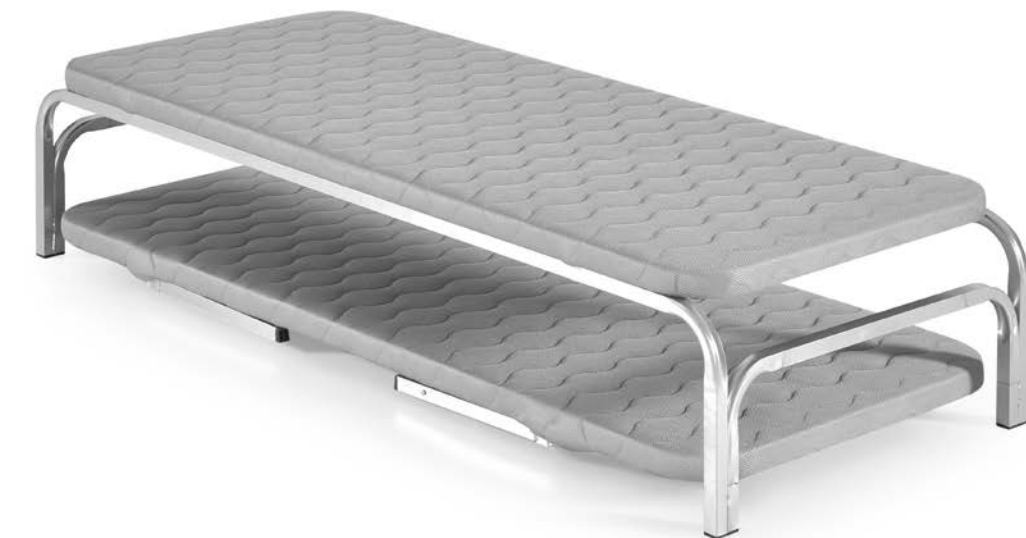
NIDO SUPERIOR TOP TRUNDLE BED

Acabado tela / Upholstered: Airfresh 3D Grey