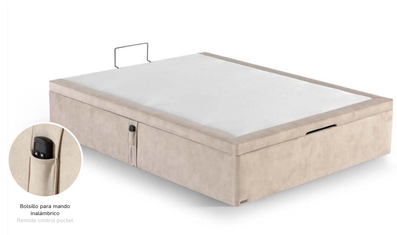
Bolsillo para mando inalámbrico Remote control pocket

TIPO B “al suelo” / TYPE B “without bed legs”